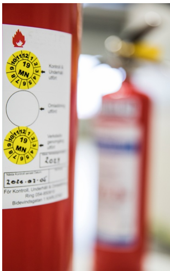
Visst underhåll av brandskyddet kan ordnas genom serviceavtal med en entreprenör.

För att i möjligaste mån förebygga brand bör det finnas särskilda villkor och rutiner för brandskyddet i byggnaden. Det är exempelvis lämpligt att helt undvika lösa föremål i trapphus eller bestämma regler för förvaringen. Det kan även behövas information om eldstäder får användas och i så fall på vilket sätt. Regler kan också behöva formuleras om var olika typer av grillar får användas och om det finns särskilda krav på hushållens förvaring av brandfarliga varor. I de fall som det bedrivs verksamheter med särskilda risker i byggnaden, såsom arbete med vinkelslipar, svetsning eller hantering av brandfarliga varor, blir behovet av villkor särskilt stort.