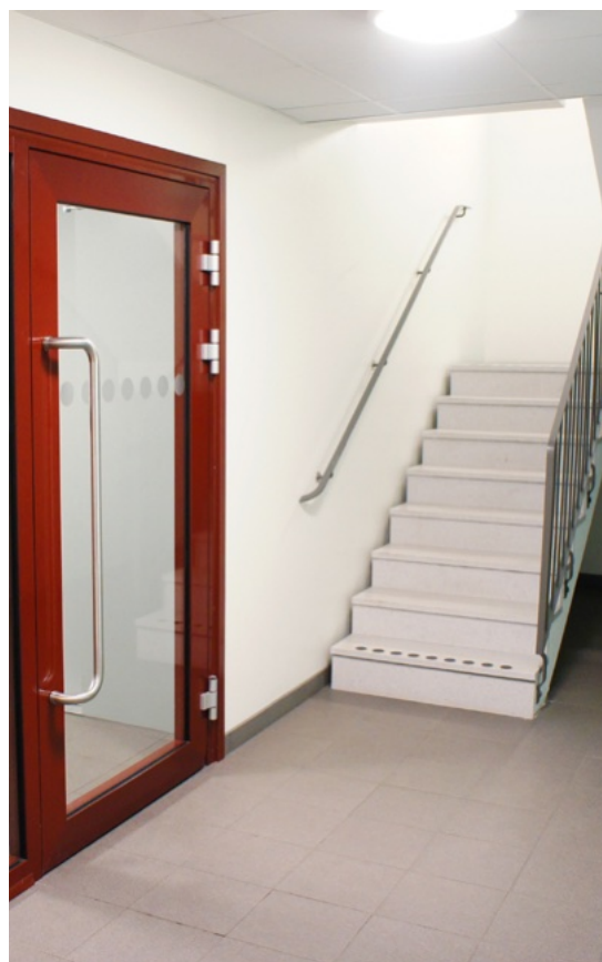
Håll trapphuset fritt från brännbara föremål och sådant som kan hindra vid utrymning.

När det gäller förvaring av föremål i trapphus kan fastighetsägare eller förvaltare ha särskilda regler för det. Regler kan även finnas av andra anledningar än brand, exempelvis för städning.