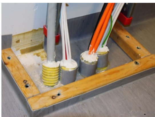
I en brandcellsgräns måste hål eller genomföringar för exempelvis ledningar eller rör brandtätas.

Genom hål och genomföringar i brandcellsgränser kan rök och brand snabbt spridas. Hål som görs i brandcellers väggar, tak och golv, exempelvis för dragning av el, fiber eller vatten, måste därför brandtätas. Brandtättningsprodukter är vanligen inte anpassade för alla typer av genomföringar eller konstruktioner, därför är det viktigt att tätning görs fackmannamässigt och i enlighet med leverantörens anvisningar. I de fall obrännbara rör byts mot brännbara rör kan det behövas brandtättningsprodukter som tätar om rören brinner av. Det finns exempelvis produkter som expanderar vid brand och klämmer ihop rör.