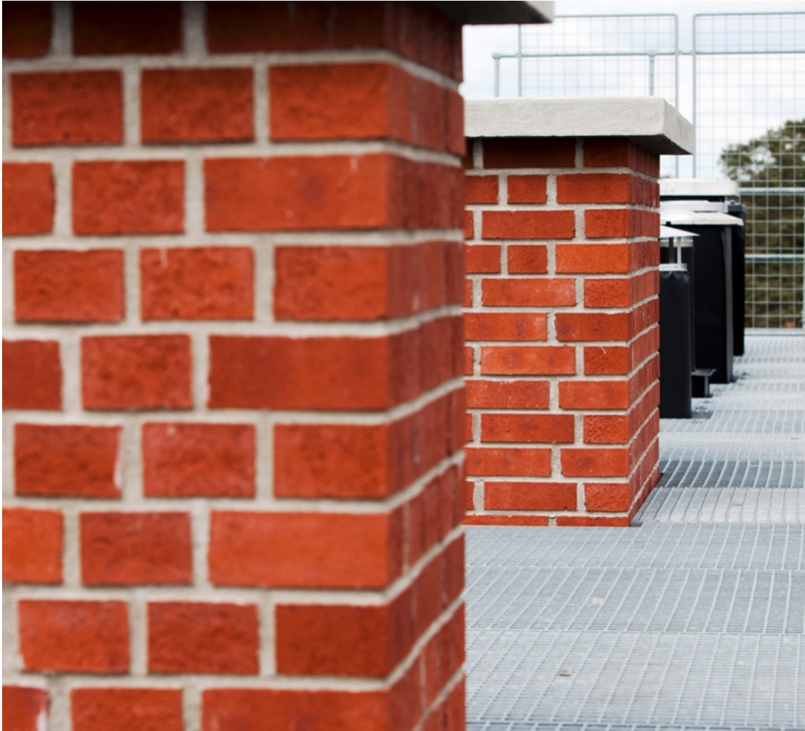
Soteld (brand i skorstenen) uppkommer vanligen på grund av pyreldning eller om veden är för fuktig. Elda enligt eldningsinstruktionen och använd torr ved.