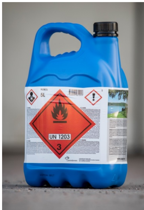
Brandfarliga varor ska hanteras på ett säkert sätt.