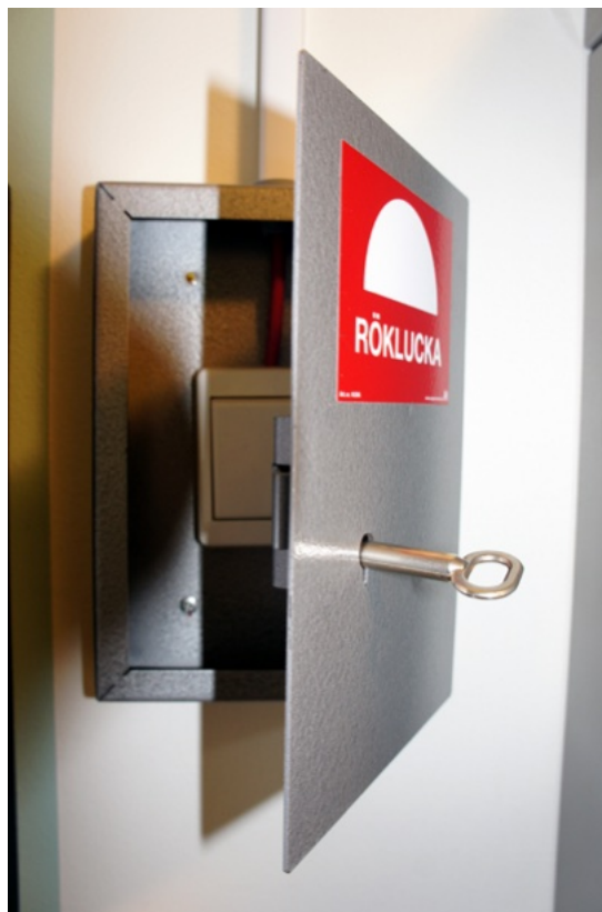
Vissa rökluckor kan öppnas med hjälp av en tryckknapp. Öppningsanordningen är oftast placerad vid entrén.