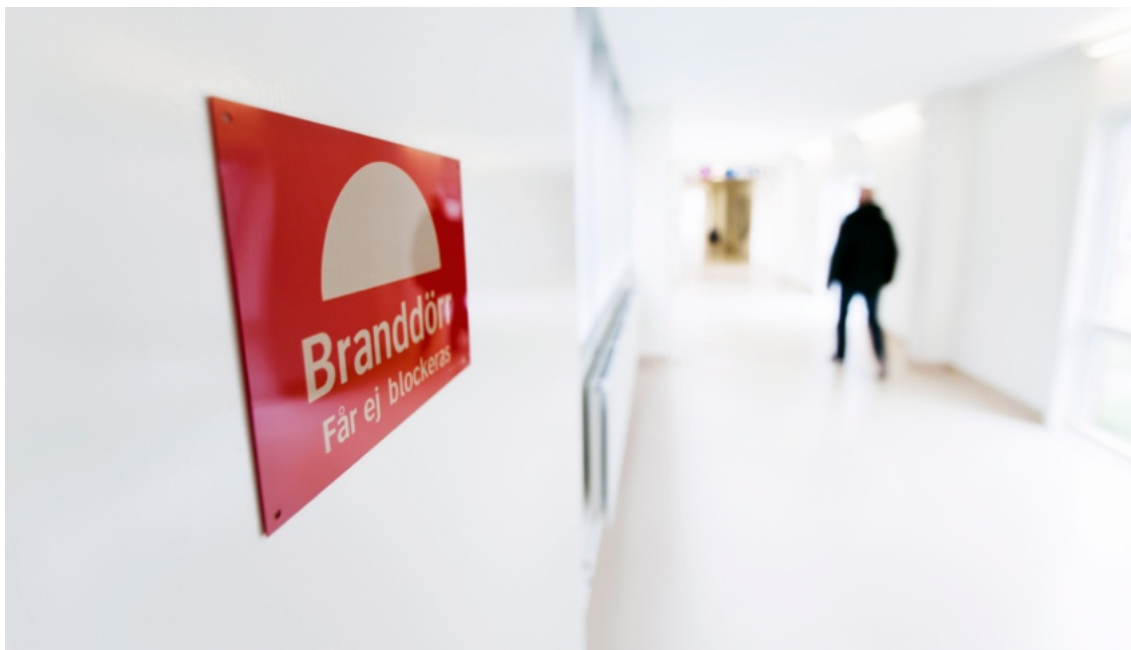
Det är viktigt att branddörrar hålls stängda. De får inte ställas upp med kilar eller dylikt.

Genom hål och genomföringar i brandcellsgränser kan rök och brand snabbt spridas. Hål som görs i brandcellers väggar, tak och golv, exempelvis för dragning av el, fiber eller vatten, måste därför brandtätas. Brandtättningsprodukter är vanligen inte anpassade för alla typer av genomföringar eller konstruktioner, därför är det viktigt att tätning görs fackmannamässigt och i enlighet med leverantörens anvisningar. I de fall obrännbara rör byts mot brännbara rör kan det behövas brandtättningsprodukter som tätar om rören brinner av. Det finns exempelvis produkter som expanderar vid brand och klämmer ihop rör.