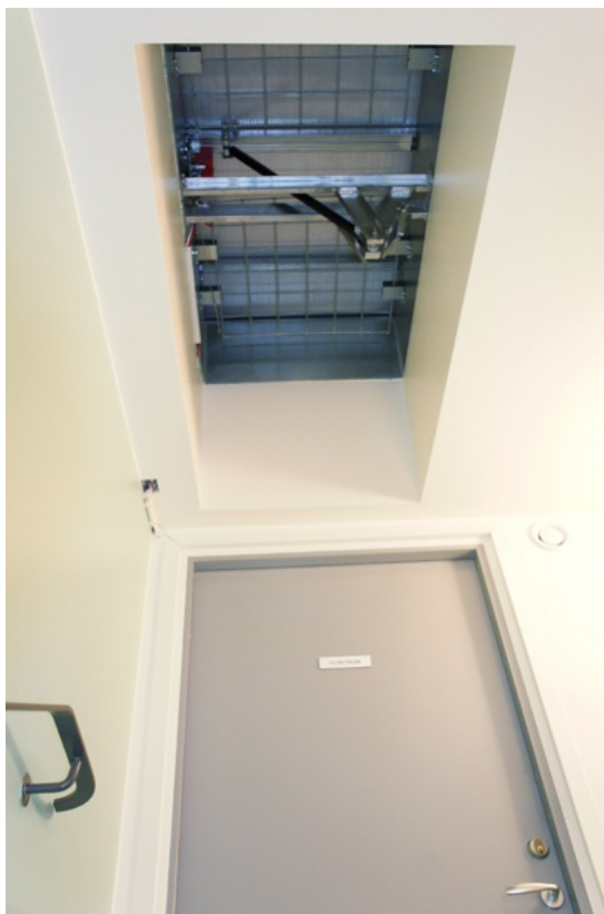
I taket syns en uppåtgående röklucka. Rökluckor används för att vädra ut brandrök. Se till att rökluckorna provas och servas regelbundet, förslagsvis årligen.

I ett trapphus kan ett öppningsbart fönster på översta våningsplanet och minst vartannat våningsplan fungera som brandgasventilation. Det är en ganska vanlig lösning för brandgasventilation i ett flerbostadshus. För att minska risken för att någon faller ut genom fönstren kan exempelvis galler monteras. Se samtidigt till att brandgasventilationen inte åsidosätts.