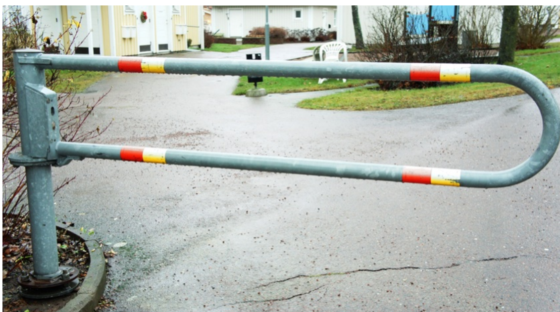
Bom som kan låsas upp med brandkårsnyckel.

Många flerbostadshus har även andra former av brandtekniska installationer. En sådan är stigarledning, som kan användas av räddningstjänsten vid en brand i byggnaden. En stigarledning kan spara värdefull tid då brandslangar inte behöver dras ända från bottenvåningen och upp till utrymmet där det brinner, istället kopplas vattnet in nedtill i eller vid trapphuset. Oftast nås stigarledningarna från trapphuset. Stigarledningar installeras vanligen i samband med att byggnaden uppförs eller ändras, om byggnaden är högre än 8 våningar. Det förekommer tyvärr att luckor saknar märkning, är övermålade och därmed svåra att både se och öppna eller att det finns andra fel på dem. Det är viktigt att en stigarledning fungerar om den behöver användas vid brand, se därför till att det finns rutiner för kontroll och skötsel.