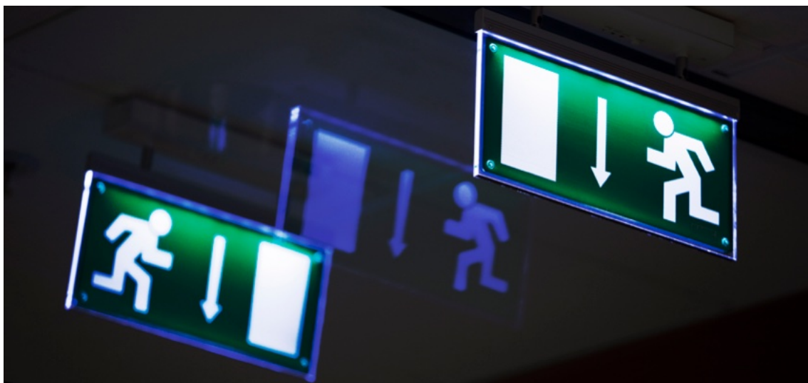
När det brinner får det inte uppstå tveksamheter kring var man kan ta sig ut. Svårorienterade utrymningsvägar i flerbostadshus ska vara markerade med utrymningsskyltar.

Observera att brandavskiljande konstruktioner i äldre flerbostadshus i trä vanligtvis har sämre brandmotstånd än i nyare flerbostadshus. Det kan till exempel snabbt brinna igenom en tunn spegeldörr i trä. Har dörren dessutom glasrutor kan branden sprida sig ännu fortare. I framförallt äldre byggnader kan det därför vara nödvändigt att göra förstärkningsåtgärder. Det kan handla om att byta ut lägenhetsdörrar om det är möjligt med hänsyn till andra krav, såsom kulturskydd, eller förstärka dem. Förstärkning kan göras på flera olika sätt. Vilka åtgärder som behövs och som är lämpliga beror på de ursprungliga förutsättningarna. Innan åtgärd väljs bör man ta reda på vilket skydd befintliga dörrar kan antas ge och därefter välja de förstärkningsåtgärder som åtgärdar bristerna. Sådana bedömningar kräver vanligen brandteknisk kompetens. I fråga om kulturbyggnader får ändringar oftast inte göras utan tillstånd från länsstyrelse eller annan ansvarig myndighet.