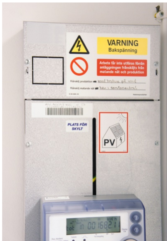
En solcellsanläggning ska förses med de varningsskyltar och den märkning som krävs.

Om en byggnad är försedd med solceller finns det krav i elinstallationsreglerna på att det ska finnas varningsanslag vid anslutningspunkten och elcentralen. Genom varningsanslagen får räddningstjänsten reda på att byggnaden är försedd med solceller och kan anpassa sin taktik vid en insats.