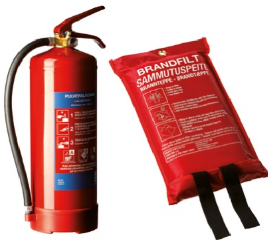
Brandsläckare och brandfilt.

Om byggnaden har en brandsektionerad vind är det lämpligt att ha skyltar med texten "Sektionering på vinden" uppsatta på fasaden där sektioneringarna finns. Då kan räddningstjänsten enklare lokalisera dem vid en insats.